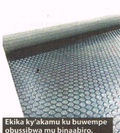
Ekika ky'akamu ku buwempe obussibwa mu binaabiro.