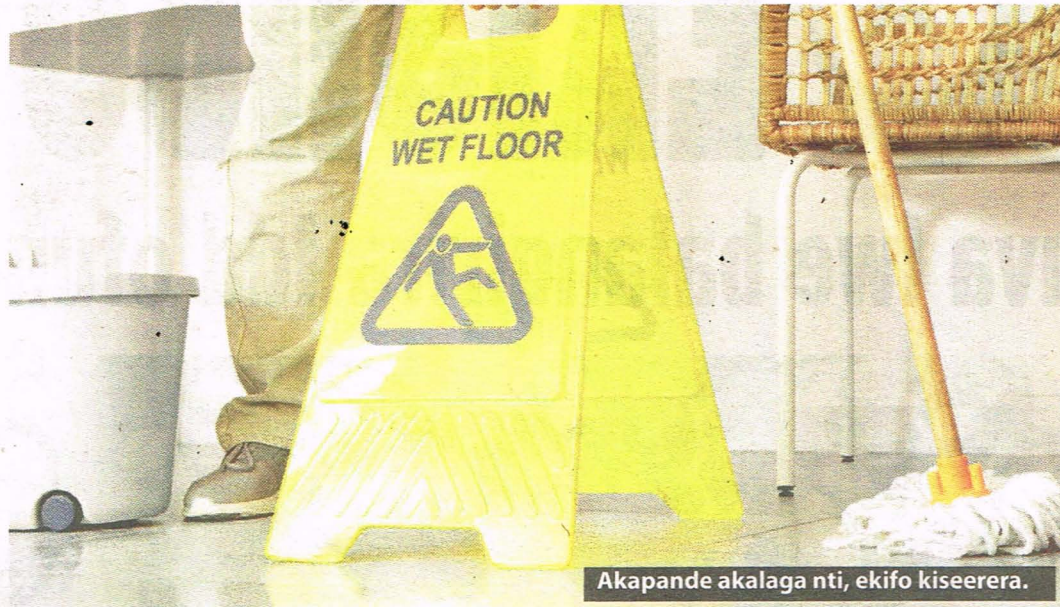
Akapande akalaga nti, ekifo kiseerera.