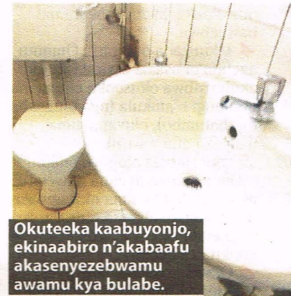
Okuteeka kaabuyonjo, ekinaabiro n'akabaafu akasenyebwama awamu kya bulabe.

buuni amenyese menyese ayinza okuseerera omuntu.