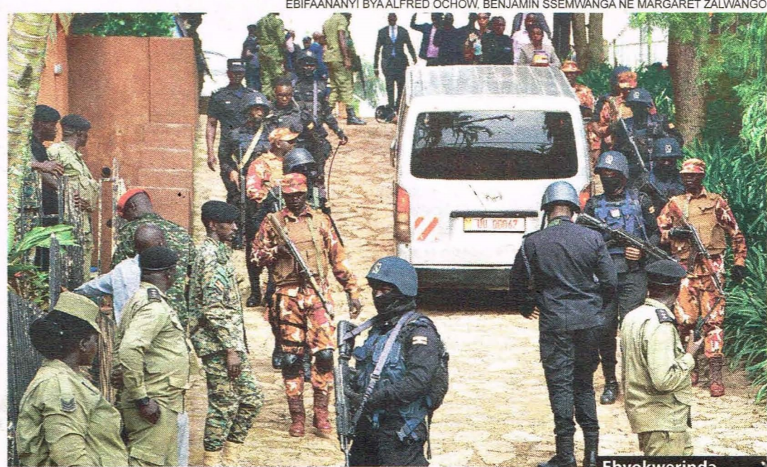
Ebyokwerinda byabadde ggulugulu nga buli wamu waliwo abaserikale.