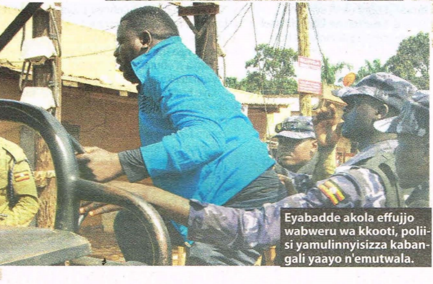
Eyabadde akola effujjo wabweru wa kkooti, polisi yamulinnyisizza kaban-gali yaayo n'emutwala.