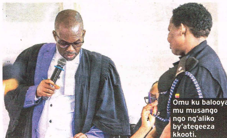
Omu ku balooya mu musango ngo ng'aliko by'ategeeza kkooti.

Makaayi: Endagaano si nze nteekako omukono, nnannyini nnyumba y'assako omukono olwo ne tumuwaako kkopi.