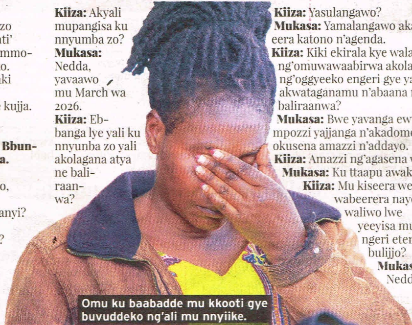
Omu ku baabadde mu kkooti gye buvuddeko ng'ali mu nnyiike.

Mukasa: Yasa-sula esatu era gye yamalawo ogwandibadde ogwoku-