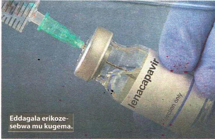
Eddagala erikoze-sebwa mu kugema.

nti omuntu yenna akubwa empiso eno, alina okumala enaku bbiri nga teyeegatta nga talina bukuumi bulala ng'akapira (kondomu). Ono yategeezezza nti wadde eddagala lino likola naye kiritwalira essaawa 48 okutuuka mu mubiri gw'omuntu gwonna.