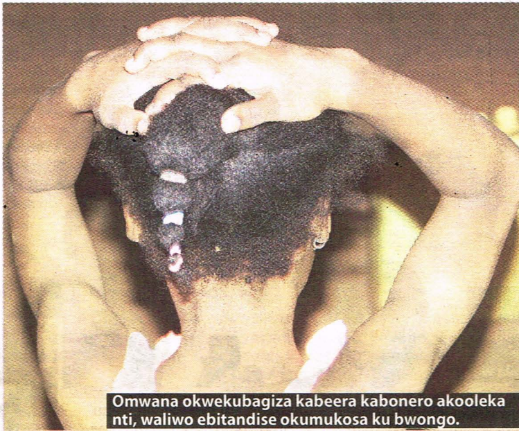
Omwana okwekubagiza kabeera kabonero akooleka nti, waliwo ebitandise okumukosa ku bwongo.

ensimbu, ssukaali, siriimu n'ebirala omuntu by'amirira eddagala obulamu bwe bwonna.