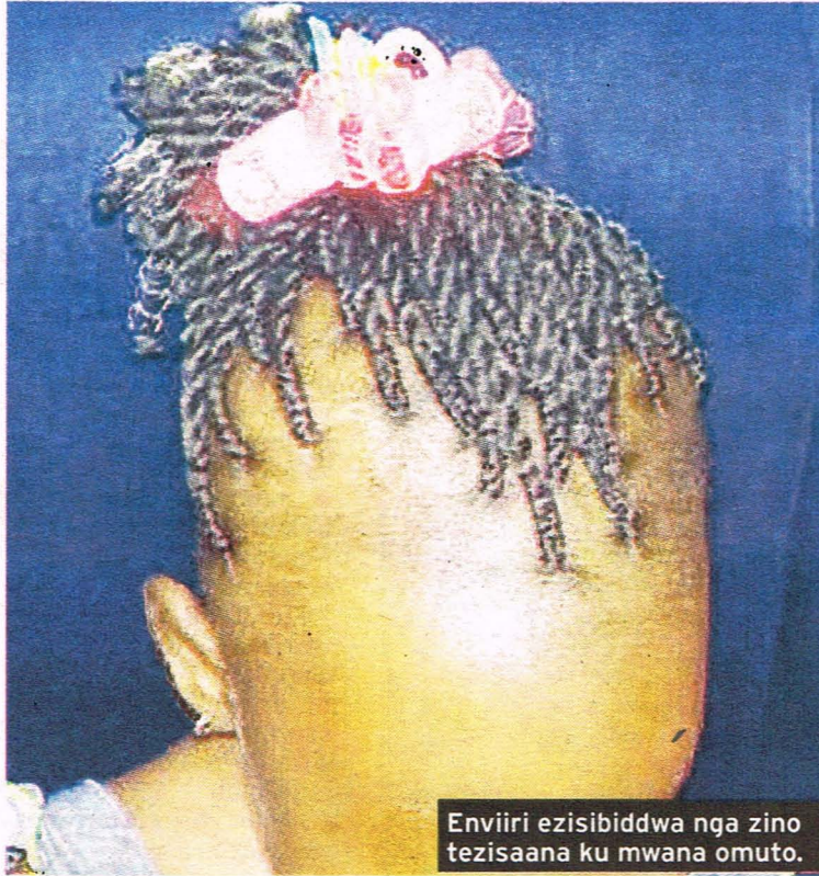
Enviiri ezisibiddwa nga zino tezisaana ku mwana omuto.

● Buli lw'osika enviiri, w'ozisikidde watera okuggyawo obuwundu obusikiriza obuwuka