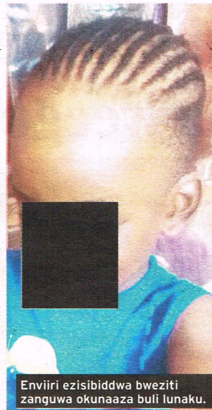
Enviiri ezisibiddwa bweziti zanguwa okunaaza buli lunaku.